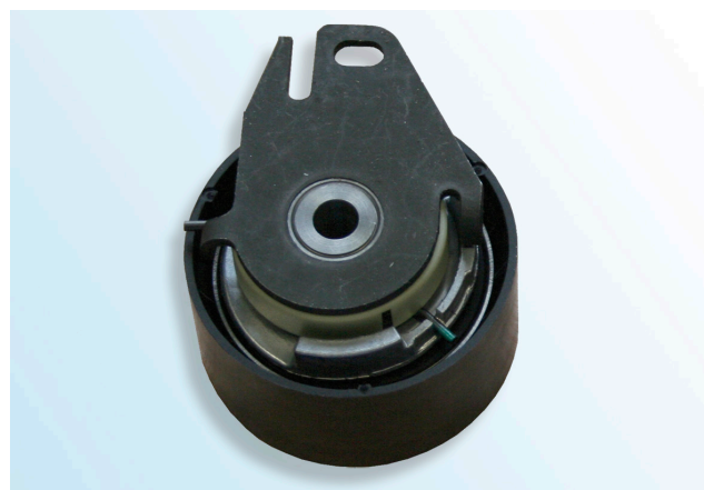
Obrázek 1: Typ OE

U výše uvedených modelů mohou být montovány dva různé typy napínacích kladek.