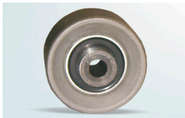
Obrázek 1: 532 0289 10 – kovové provedení