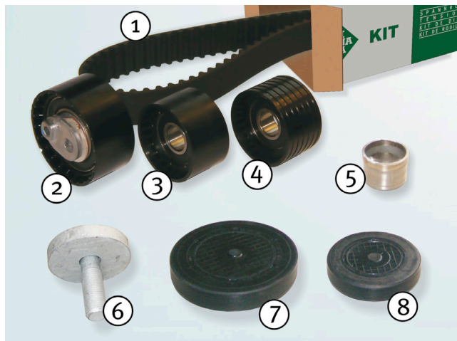
Obrázek 2: Obsah KIT 530 0342 10

Obrázek 2 ukazuje obsah sady KIT 530 0342 10, která obsahuje veškeré potřebné díly pro výměnu ozubeného řemenu: