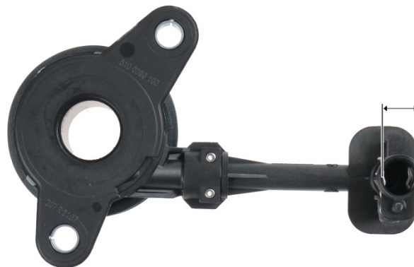
Obr. 4: CSC 3182 600 140 → 3182 654 204 Hydraulický přívod o průměru 12,2 mm

Upozorňujeme, že hydraulické přívody koncentrických pracovních válců nejsou zobrazené v měřítku.