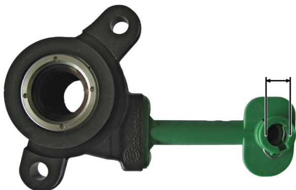
Obr. 1: CSC 3182 600 121 → 3182 654 165 Hydraulický přívod o průměru 11,7 mm