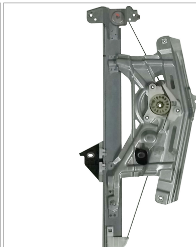
ORIGINAL POWER WINDOW LEFT ALZACRISTALLI ELETTTRICO ORIGINALE SX