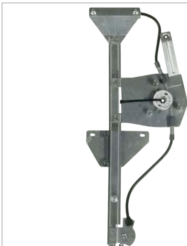
POWER WINDOW LEFT ALZACRISTALLI ELETTTRICO SX

THIS INSTALLATION INSTRUCTION IS FOR BOTH LEFT AND RIGHT SIDE. CETTE INSTRUCTION DE MONTAGE EST POUR LES DEUX COTES DROIT ET GAUCHE. DIESE MONTAGE-ANLEITUNG IST FÜR DIE BEIDE LINKE UND RECHTE SEITE. ESTA INSTRUCCION DE MONTAJE ES PARA LOS DOS LADOS IZQUIERDO Y DERECHO. ESTA INSTRUÇÕES VALEM TANTO PARA O LADO ESQUERDO QUANTO PARA O DIREITO. DEZE AANWIJZINGEN GELDEN VOOR ZOWEL DE LINKER- ALS DE RECHTERKANT. Η ΠΑΡΟΥΣΑ ΟΔΗΓΙΑ ΑΦΟΡΑ ΤΟΣΟ ΤΗΝ ΑΡΙΣΤΕΡΗ ΟΣΟ ΚΑΙ ΤΗ ΔΕΞΙΑ ΠΛΕΥΡΑ. LA PRESENTE ISTRUZIONE VALE SIA PER IL LATO SINISTRO CHE PER IL LATO DESTRO.